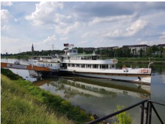
Museumsschiff vom Technoseum

Ich schoss schnell ein paar Fotos vom Brunnendenkmal und vom Alten Rathaus. Dann gingen wir wieder nach Norden, zum Museumsschiff, anschließend in den Hafen Richtung Jungbusch.