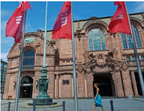
Mannheim Rosengarten, Blick aus dem fahrenden Auto

Gestern ging es mal wieder nach Mannheim. Wir haben ja früher dort gewohnt, aber immer zu wenig Zeit für Ausflüge oder Besichtigungen gehabt. Jetzt hatte sich in unserem Leben vor ein paar Monaten vieles geändert und wir haben deutlich mehr Möglichkeiten, um das nachzuholen. Mannheim kennen wir eigentlich schon ganz gut, aber auch noch nicht alle Ecken. Und so war unser erstes Ziel die „Alte Feuerwache“ und die „Neckarwiese“ im Stadtteil „Neckarstadt“. Die erste Aufgabe bestand darin, einen geeigneten Parkplatz zu finden, der nicht zu weit vom Fluss entfernt ist.