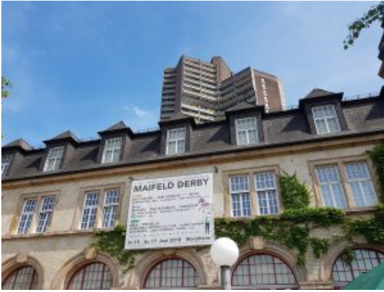
Alte Feuerwache, dahinter Wohnhaus

Wenn man links rum geht, hat man schönes Mannheimer Ghetto-Feeling. Jugendliche hängen ab und hören Musik, die Wände und Türen sind teilweise gesprayt.