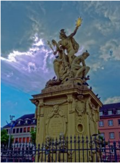
Brunnendenkmal am Marktplatz

eine positive Art und Weise)- die Umgebung hatte sich schlagartig verändert- geht man ein paar Schritte weiter, ist man man wieder in Deutschland. Irgendwie verrückt.