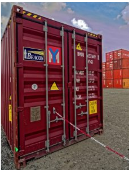
Container aus Amerika

Als wir den Rundgang beendet hatten, zeigte der Schrittzähler knapp 10.000 Schritte an, das tägliche Soll war erfüllt. Voll geladen mit vielen Eindrücken fuhren wir zufrieden nach Hause.