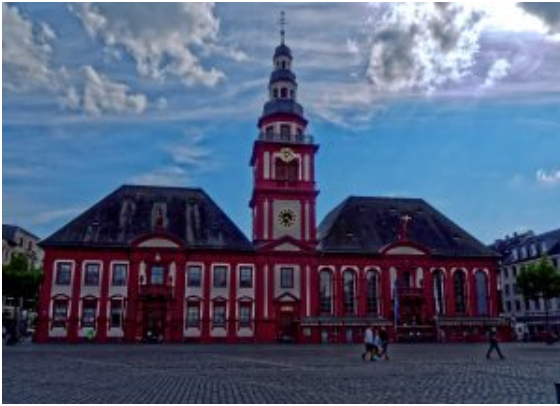
Mannheim Altes Rathaus am Marktplatz

Der Ausländeranteil steigt plötzlich stark an, man sieht sehr viele Türken, Dunkelhäutige und osteuropäisch sprechende Menschen. Es gibt Volk, das abhängt und den freien Tag genießt. Mir war erst gar nicht bewusst, was passiert war, denn aus der heterogenen Bevölkerung, die noch am Strand geherrscht hatte, wurde es plötzlich separiert und „fremder“. Dann wurde mir klar, dass wir im sogenannten „Türkenviertel“ von Mannheim angekommen waren. Ein im Grunde recht klar und eng abgesteckter Bereich in Mannheim, der von sehr vielen Türken bewohnt wird. Es gibt „arabische Restaurants“, sehr viele Dönerläden, aber auch Brautmodengeschäfte, türkische Supermärkte und Friseure, Goldhändler und Anwälte.