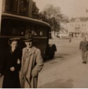
Meine Oma und Opa.. vor sehr langer Zeit. Ca. in den 1930ern.