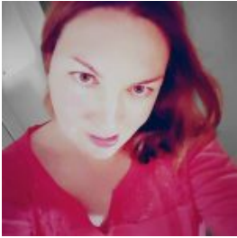
meine rote Seite