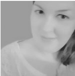
meine ausgeglichene Seite