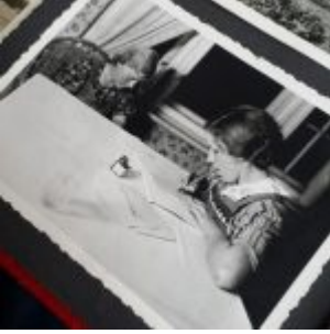
Meine Oma (im Vordergrund)